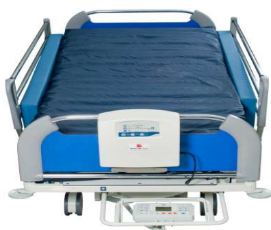
Heavy Bed Basic

Besondere Situationen erfordern besondere Maßnahmen