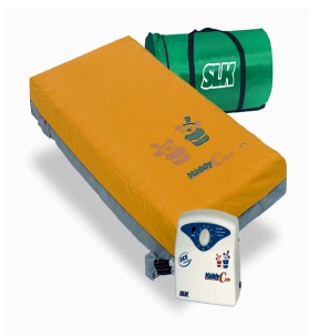
Komplett Ersatz System

Aufgrund erheblicher Schwierigkeiten bei der Lagerung von pflegebedürftigen Kindern ist das Kiddy care System entwickelt worden.